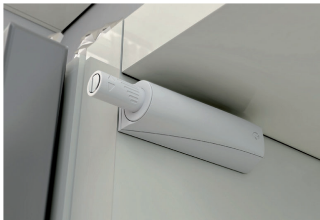
K Push Tech

umożliwia zwiększenie przenoszonego obciążenia na półkę. Materiał: stop cynku i stali. Wyposażony w trzy, niezależne regulacje: pionową – dla idealnego wyrównania wsporników na ścianie, poziomą – aby skomponować luz wiercenia i łatwo zamontować półkę, nachylenia – można przeprowadzić z częściową nałożoną półką, przy pomocy klucza, daje możliwość przeprowadzenia szybkiej i precyzyjnej regulacji